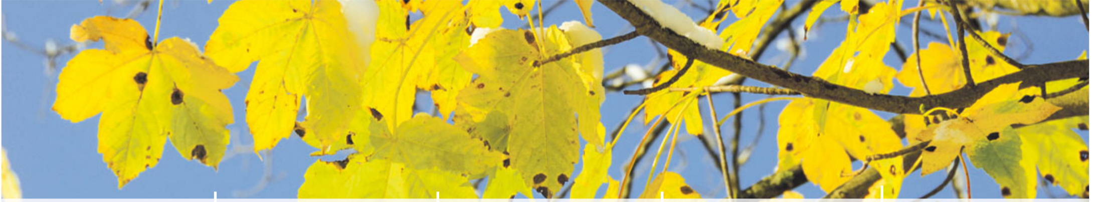
Alpabzug Schwarzenburg