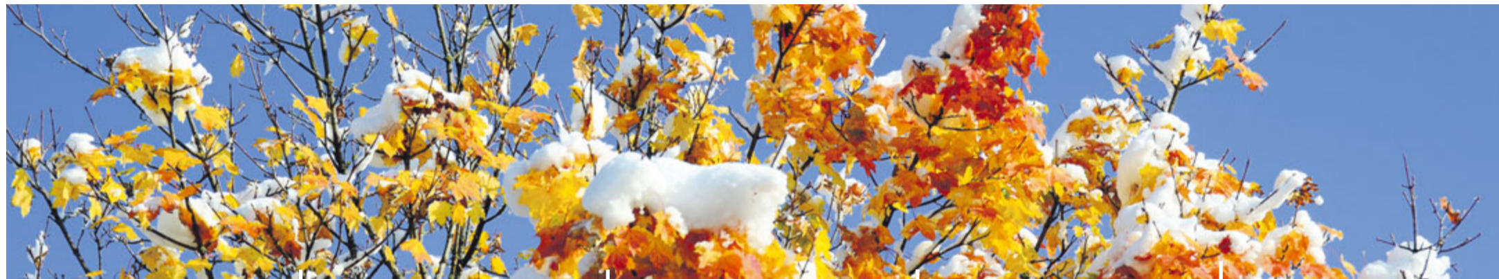
Erster Schnee im Gürbetal