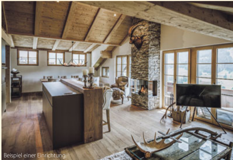
Beispiel einer Einrichtung.

Polstergruppen, Sideboards, Esstische, Stühle, Schränke, Betten und Bettinhalte sowie diverse Wohnaccessoires – bei Möbeltrend findet jeder das Passende. Und wenn es einmal eine ganze Einrichtung sein darf, steht Möbeltrend mit einer Einrichtungsberatung als erfahrener Profi gerne zur Seite.