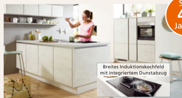
Breites Induktionskochfeld mit integriertem Dunstabzug

Aktionen gültig für Bestellungen vom 22.10. - 21.12.2019