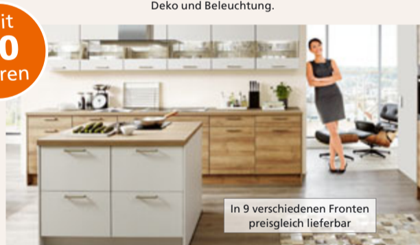
In 9 verschiedenen Fronten preisgleich lieferbar