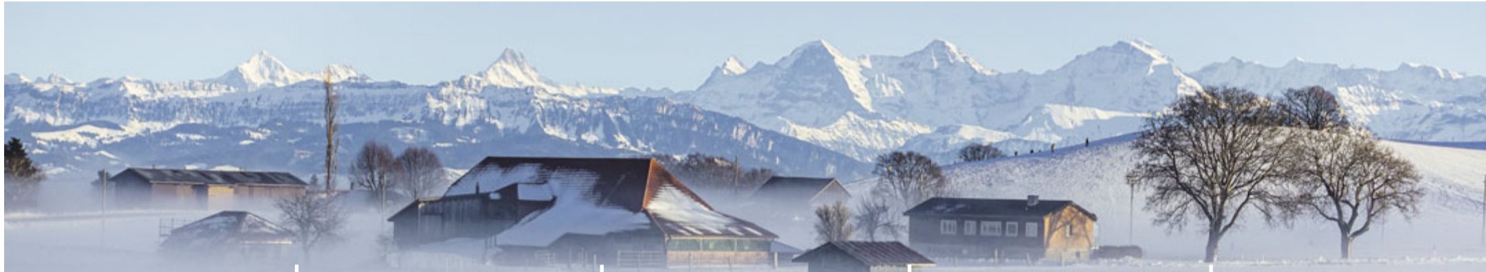
Auf dem Längenberg