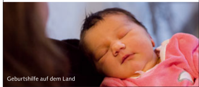
Geburtshilfe auf dem Land

Spital Münsingen, Geburtsabteilung/Hebammen Krankenhausweg, 3110 Münsingen Telefon +41 31 682 81 60, www.spitalmuensingen.ch