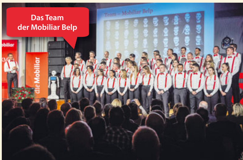
Das Team der Mobiliar Belp