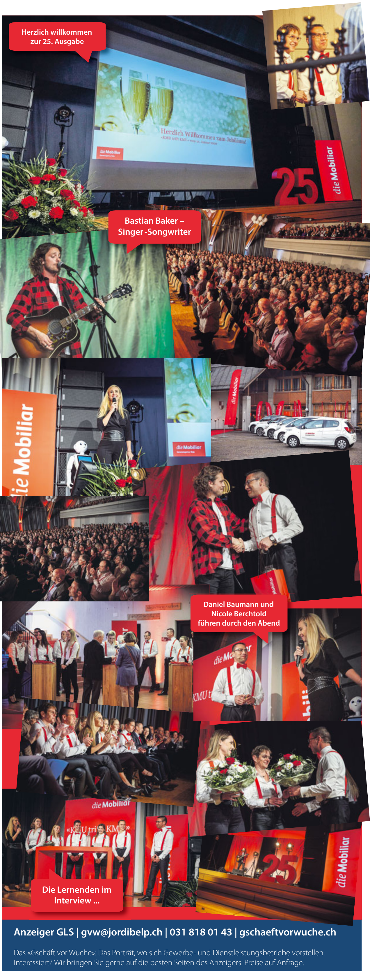
Herzlich willkommen zur 25. Ausgabe

die Mobiliar Generalagentur Belp Bahnhofstrasse 11 3123 Belp 031 818 44 44