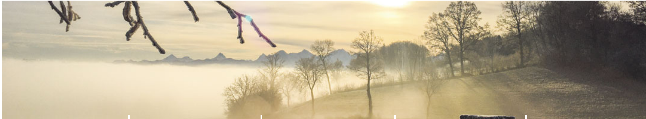
Aussicht vom Längenberg/Niedermuhlern