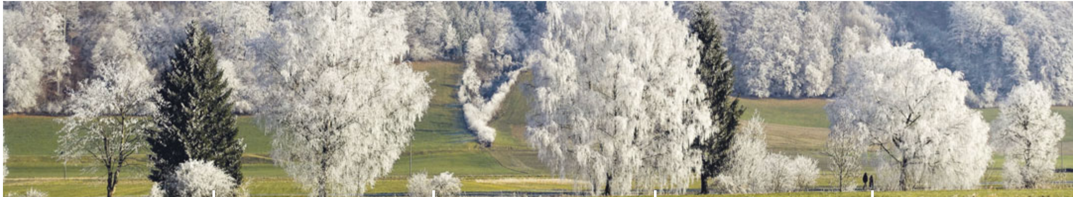
Rauhreifzauber im Gürbetal