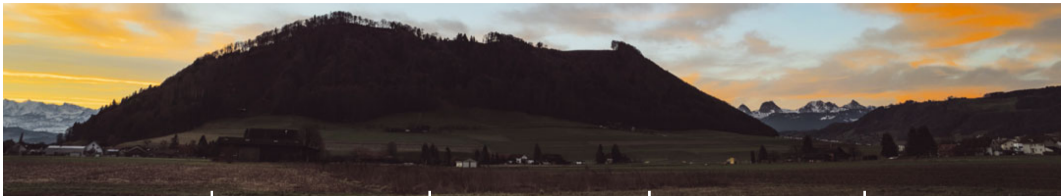
Sunrise Belpberg Yschlag