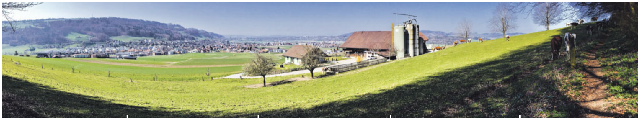
Panorama Spaziergang Breiten Belp