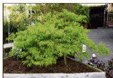
Jap. Zwergahorn bis 2 m

Lorbeer bis 3 m Buchs bis 3 m Magnolien bis 3 m Rhododendron Nadelgehölze bis 7 m