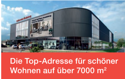
Die Top-Adresse für schöner Wohnen auf über 7000 m 2

Der Abverkauf in Heimberg läuft auf Hochtouren Das Wohncenter schliesst endgültig wegen Geschäftsaufgabe.