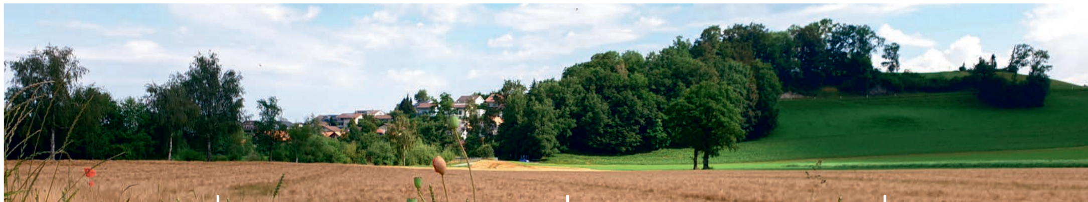
Aufnahme in Schwarzenburg