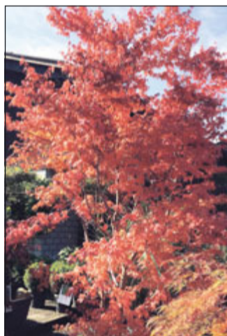
Japanischer Ahorn 30%