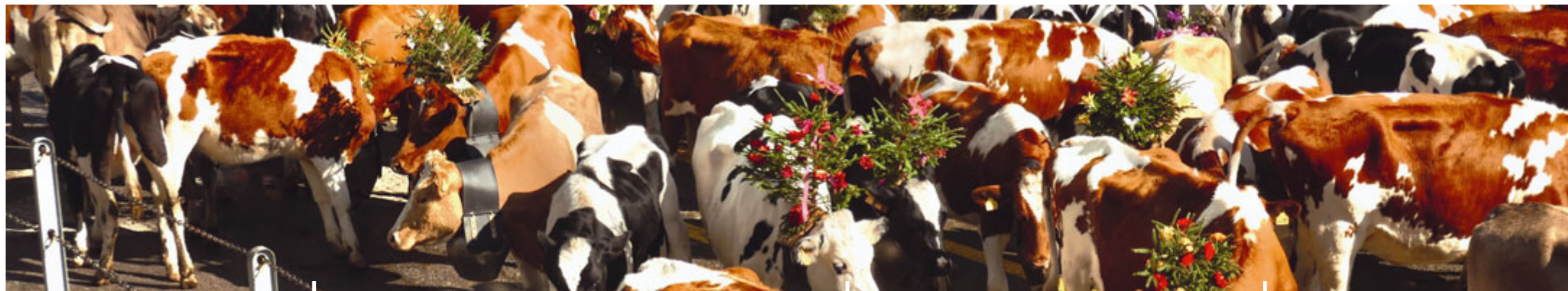
Alpabzug Schwarzenburg