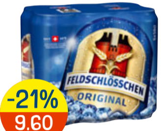
-21% 9.60 statt 12.30 FELDSCHLÖSSCHEN ORIGINAL Dose, 6 x 50 cl