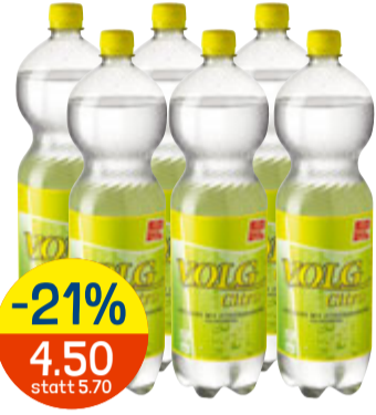
-21% 4.50 statt 5.70 VOLG CITRO 6 x 1,5 l