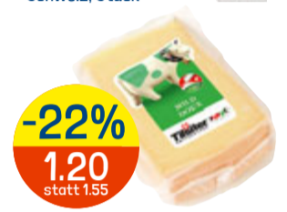
-22% 1.20 statt 1.55 TILSITER MILD per 100 g