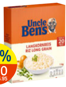
-21% 4.70 statt 5.95 UNCLE BEN'S REIS div. Sorten, z.B. Langkornreis, 20 Min., 1 kg