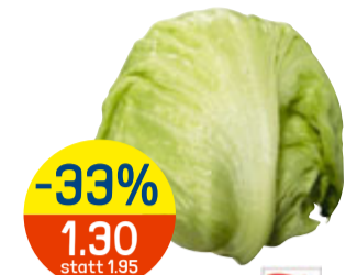
-33% 1.30 statt 1.95 EISBERG SALAT Schweiz, Stück