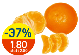
-37% 1.80 statt 2.90 MANDARINEN SATSUMA Spanien, per kg