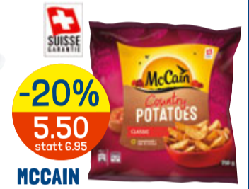
-20% 5.50 statt 6.95 MCCAIN COUNTRY POTATOES 750 g

Folgende Wochenhits sind in kleineren Volg-Läden evtl. nicht erhältlich: