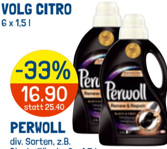
-33% 16.90 statt 25.40 PERWOLL div. Sorten, z.B. Black, Flüssig, 2 x 1,5 l