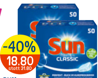
-40% 18.80 statt 31.80 SUN div. Sorten, z.B. Classic, Tabs, 2 x 50 MG