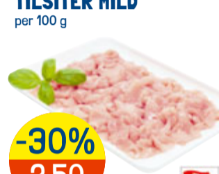
-30% 2.50 statt 3.60 SUTTERO POULETGESCHNETZELTES per 100 g