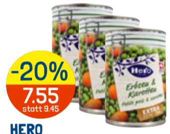
-20% 7.55 statt 9.45 HERO GEMÜSEKONSERVEN div. Sorten, z.B. Erbsen & Karotten, 3 x 260 g