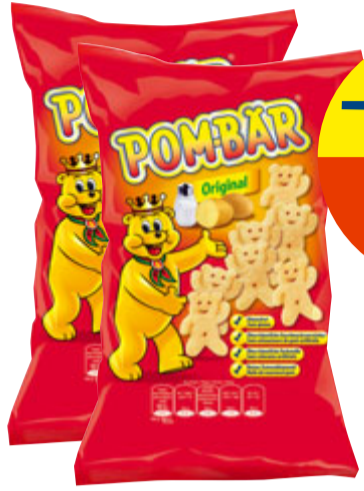
POM-BÄR Original, 2 x 100 g