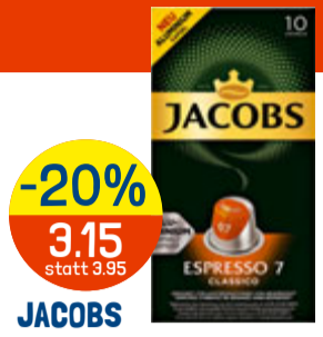
-20% 3.15 statt 3.95 JACOBS KAFFEEKAPSELN div. Sorten, z.B. Espresso classica, 10 Kapseln