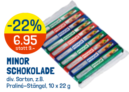
-22% 6.95 statt 9.- MINOR SCHOKOLADE div. Sorten, z.B. Praliné-Stängel, 10 x 22 g