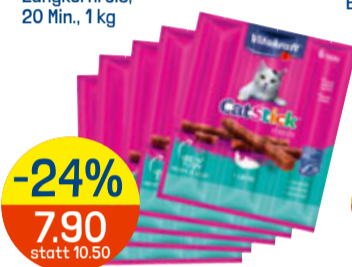
-24% 7.90 statt 10.50 VITAKRAFT div. Sorten, z.B. Cat Stick Lachs, 5 x 6 Stück