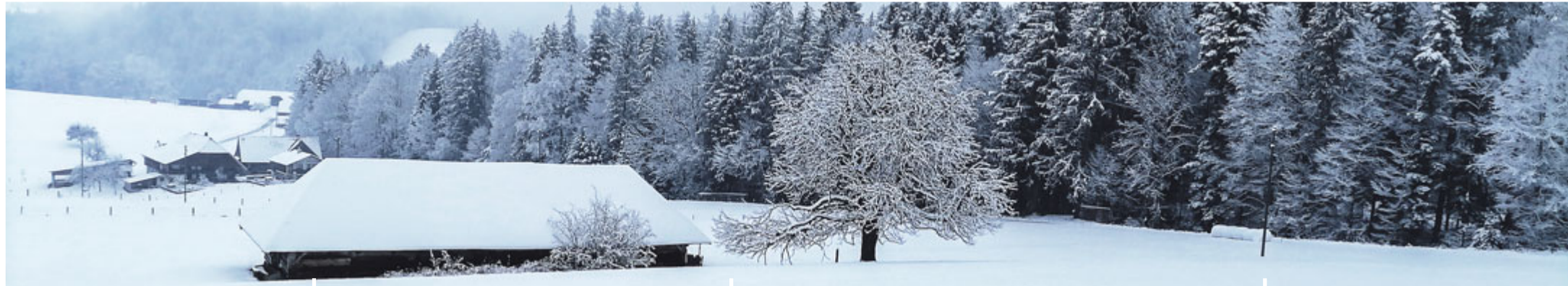
Rüschegg-Heubach (Schwand)