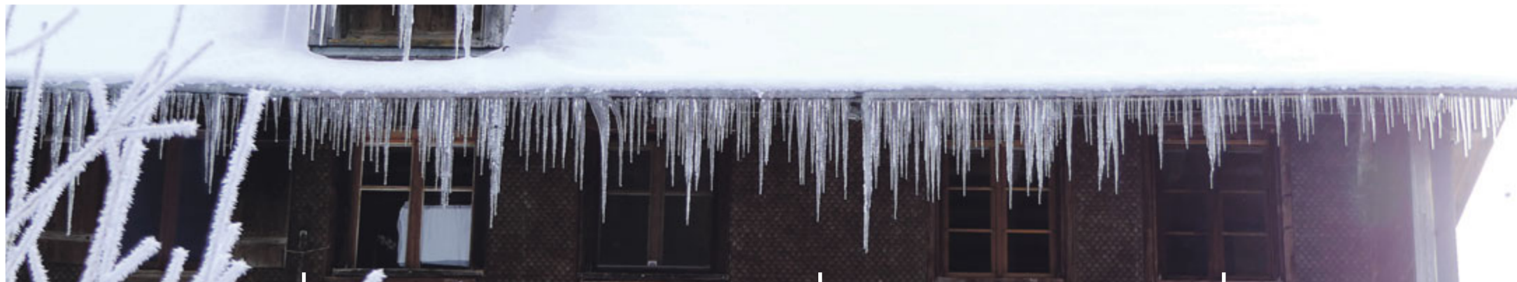
Schnee und Frost