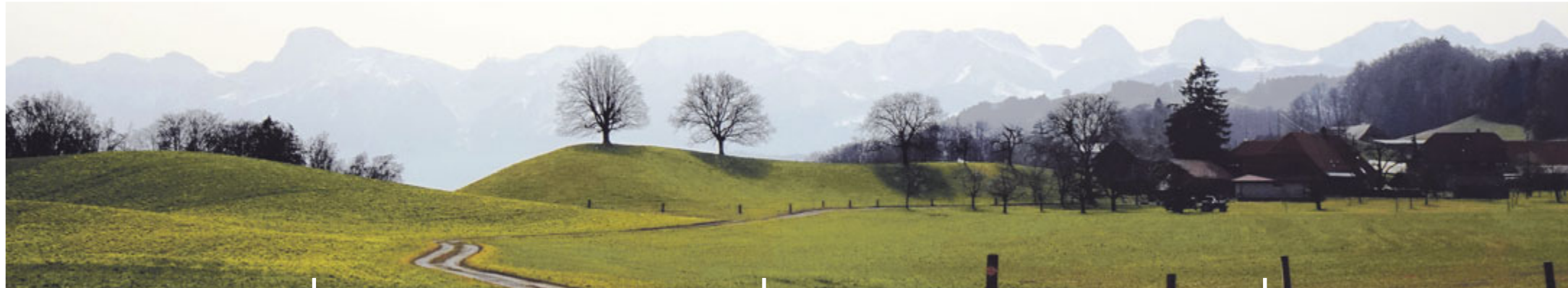
Auf dem Längenberg, Weiler Hofmatt