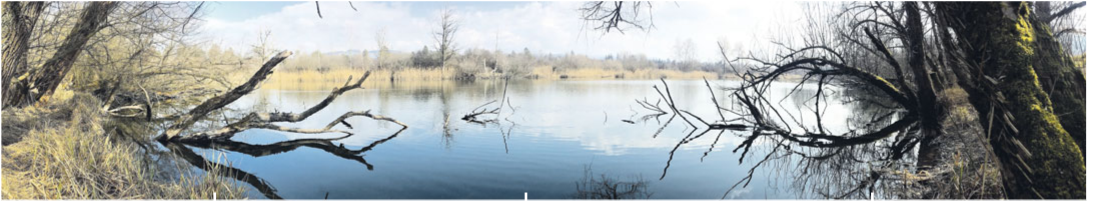
Gewässer in der Hunzigenau