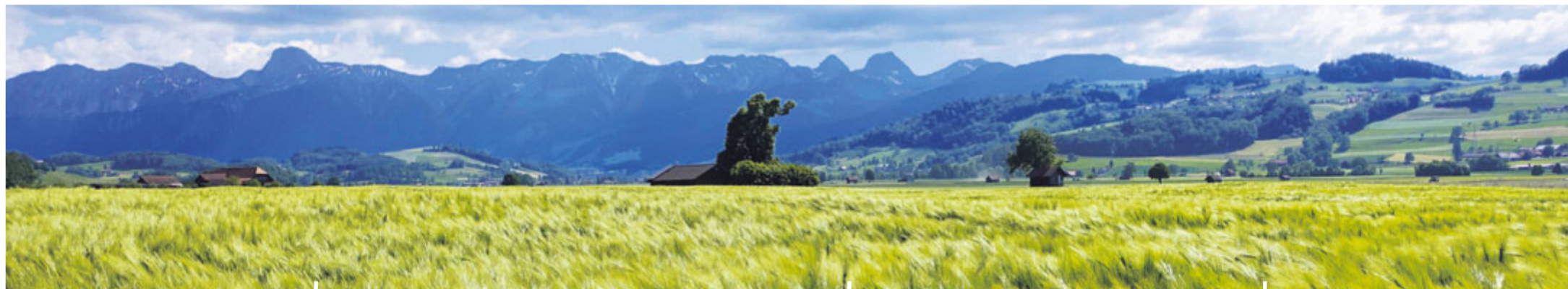
Im Thurnen-Moos Hanspeter_Etter