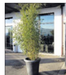
Bambus 2 m ab Fr. 79.-

Lorbeer bis 3 m Buchs bis 3 m Magnolien bis 3 m Rhododendron Nadelgehölze bis 7 m