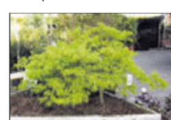
Jap. Zwergahorn bis 2 m