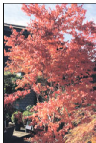
Japanischer Ahorn 30%

Bambus, Palmen, Moorbeetpflanzen und Sträucher. Grosse Bäume in Münsingen bis 70% Rabatt