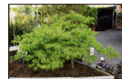
jap. Zwergahorn bis 2 m