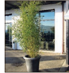
Bambus 2 m ab Fr. 79.-