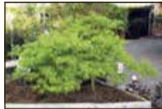
jap. Zwergahorn bis 2 m