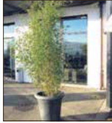
Bambus 2 m ab Fr. 79.-