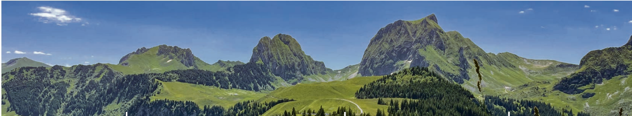
Foto: Gantrisch-Gumigel, Bergsommerbeginn