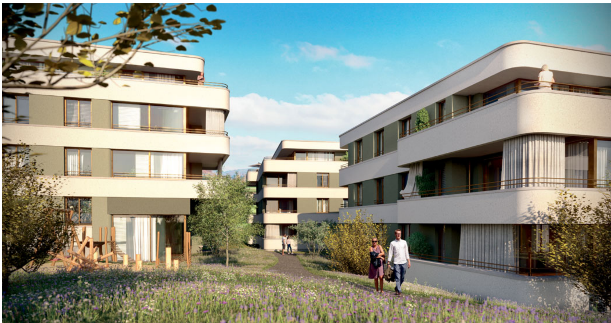
Einblick in die Neubausiedlung Toffematt