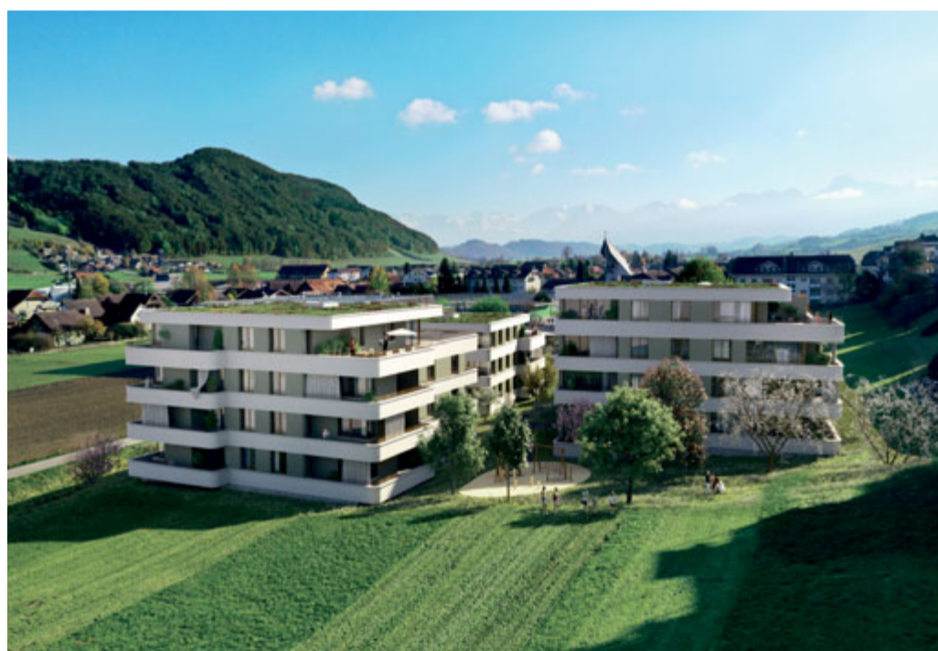
Idyllisch eingebettet in das grossartige Naturgebiet des Gürbetals

Die Gemeinde hat tatsächlich einiges zu bieten: Toffen liegt am Fusse des Längenbergs, malerisch eingebettet ins Gürbetal und zählt zu den Parkgemeinden des Naturparks Gantrisch. Entsprechend umfasst ein grossartiges Naturgebiet das idyllische Dorf. Die Gemeinde verfügt über eine sehr gute Nahversorgung für sämtliche Güter des täglichen Bedarfs: Lebensmittelladen, Käserei, Bäckerei, Post und Bank, Café und Restaurant. KITA, Kindergarten und Schulen runden das Bildungs- und Betreuungsangebot für Familien ab. Des Weiteren bieten die Schul- und Sportanlagen und die grüne Umgebung zahlreiche Möglichkeiten für Bewegungsbegeisterte von Jung bis Alt.