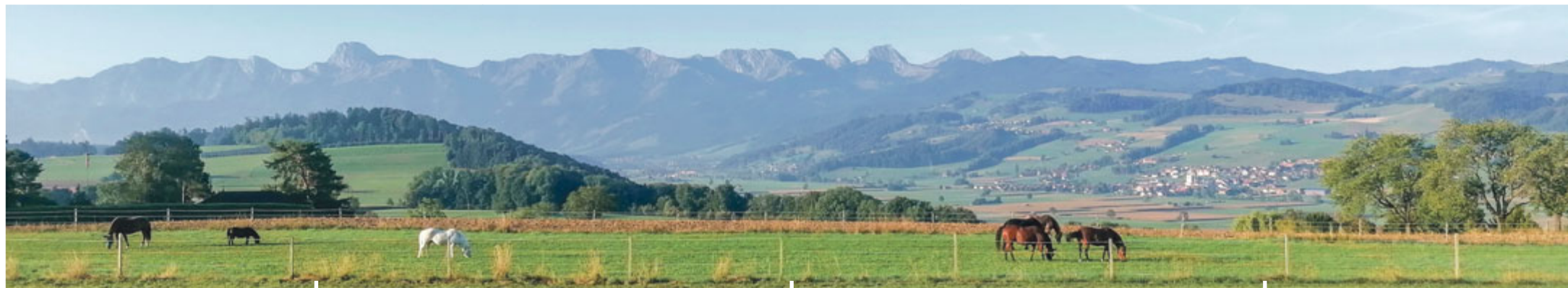
Morgenidylle in Mühledorf