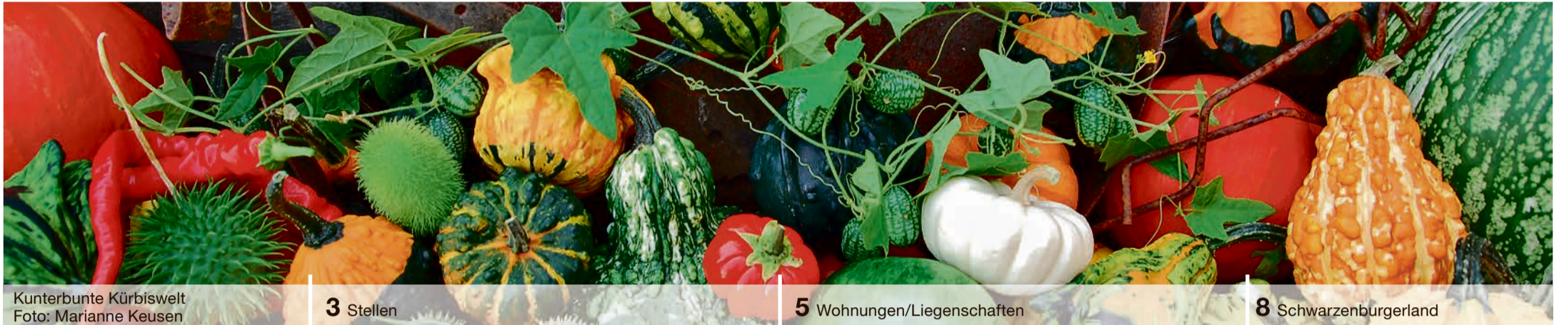
Kunterbunte Kürbiswelt

Amtlicher Anzeiger für die Gemeinden: Belp | Gerzensee | Guggisberg | Jaberg Kaufdorf | Kirchdorf | Niedermuhlern Riggisberg | Rüeggisberg | Rüscheegg Schwarzenburg | Thurnen | Toffen | Wald