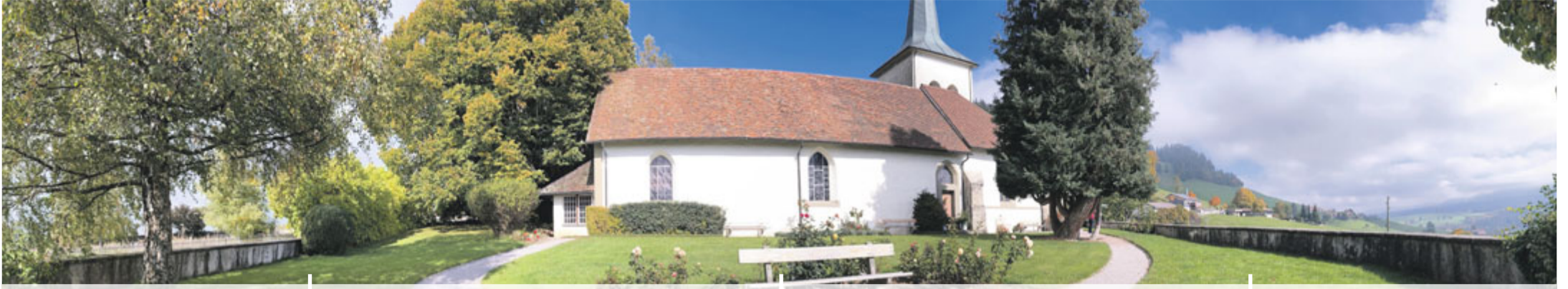
Kirche Guggisberg

Amtlicher Anzeiger für die Gemeinden: Belp | Gerzensee | Guggisberg | Jaberg Kaufdorf | Kirchdorf | Niedermühlern Riggisberg | Rüeggisberg | Rüscheegg Schwarzenburg | Thurnen | Toffen | Wald