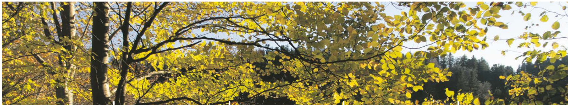
Herbstwald im Gantrischgebiet