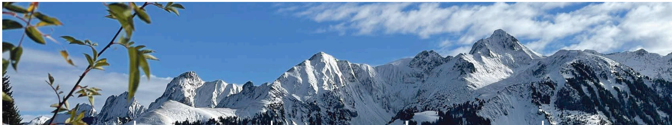
Die Ganterschneise im Vorwintertkleid