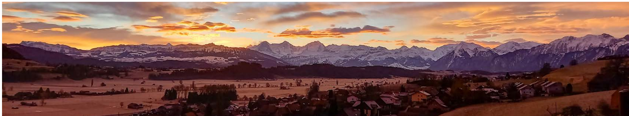
Gurbetal im zauberhaften Morgenlicht