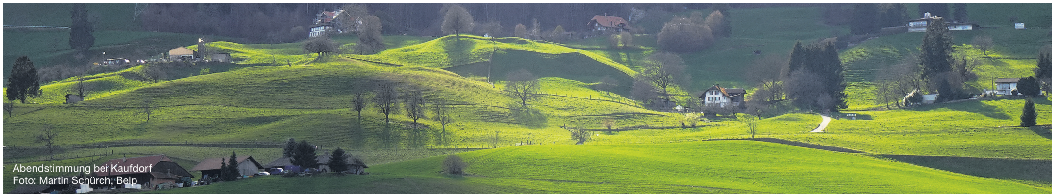
Abendstimmung bei Kaufdorf