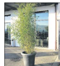
Bambus 2 m ab Fr. 79.–