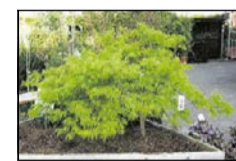
jap. Zwergahorn bis 2 m