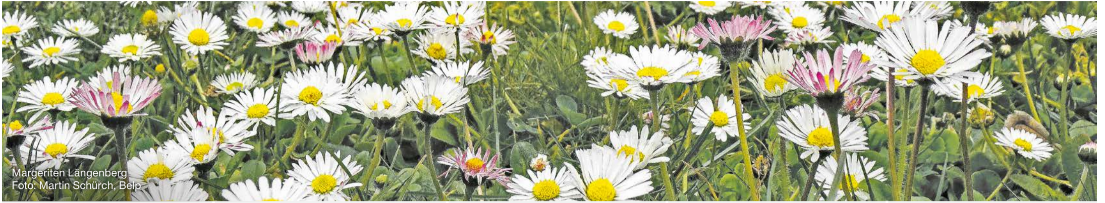
Margeriten Längenberg