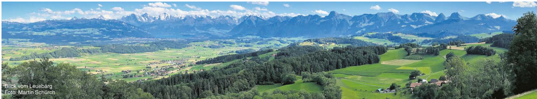
Blick vom Leuebärg