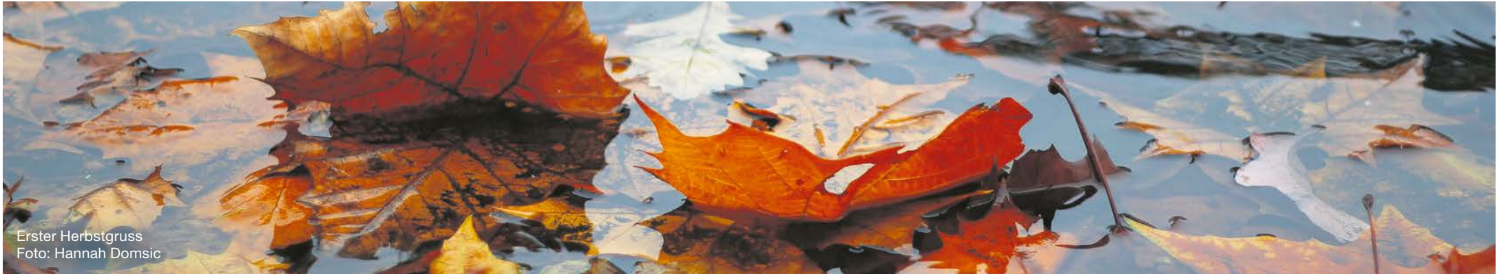
Erster Herbstgruss