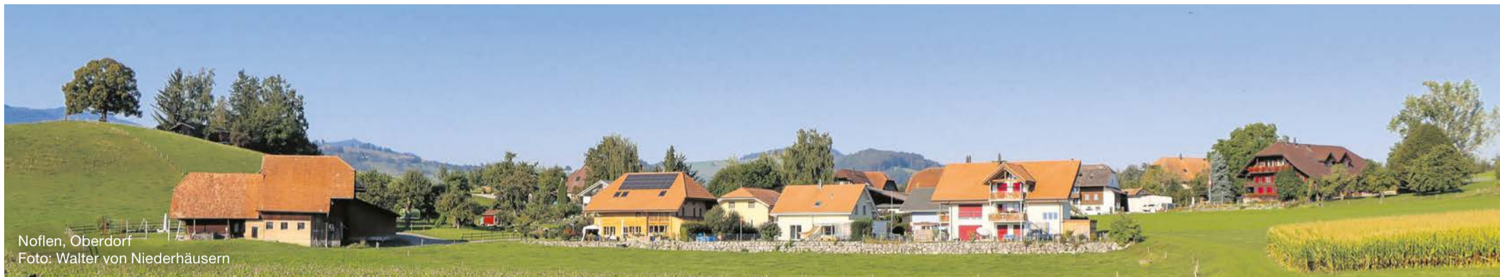
Noflen, Oberdorf