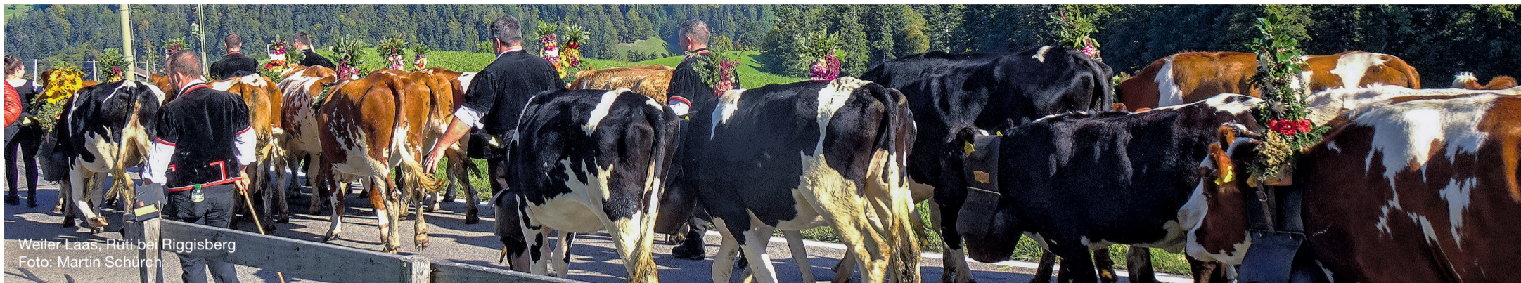
Weiler Laas, Ruti bei Riggisberg

3 Stellenmarkt 5 Wohnungen/Liegenschaften 6 Todesanzeigen/Danksagungen 9 Veranstaltungen 10 Schwarzenburgerland