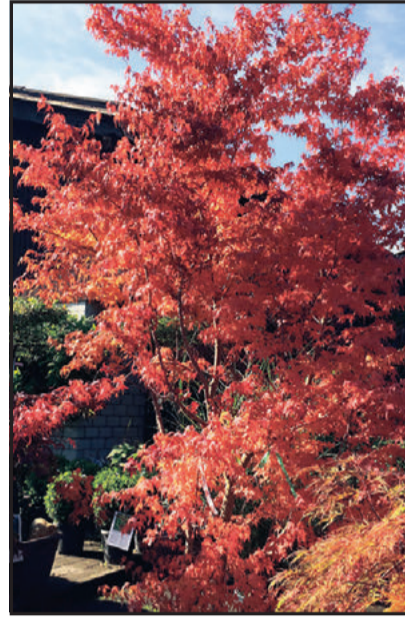
Japanischer Ahorn 30%

Bambus, Palmen, Moorbeetpflanzen und Sträucher. Grosse Bäume in Münsingen bis 70% Rabatt