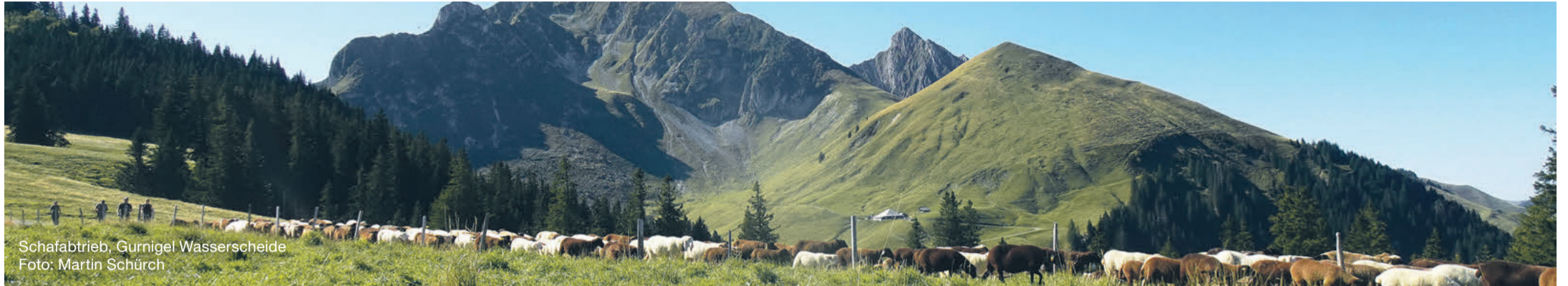
Schafabtrieb, Gurnigel Wasserscheide