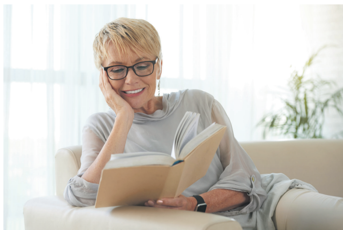
Es soll vor Spannung im Roman, nicht aber in den Händen kribbeln.

Du liegst auf der Couch, liest ein Buch, streamst auf dem Tablet die neuste Serie oder surfst auf deinem Smartphone. Das wäre total entspannend, wenn dir nicht schon nach kurzer Zeit die Hände einschlafen würden. Kennst du dieses Gefühl? Neben Arme schütteln und Fingerkneten kann auch Tibetisches Kräuterwissen helfen.