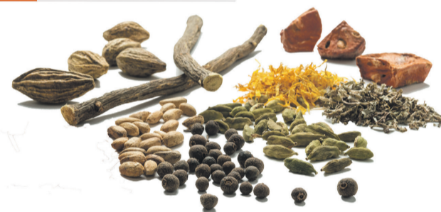
Dies ist ein zugelassenes Arzneimittel. Lesen Sie die Packungsbeilage. PADMA AG