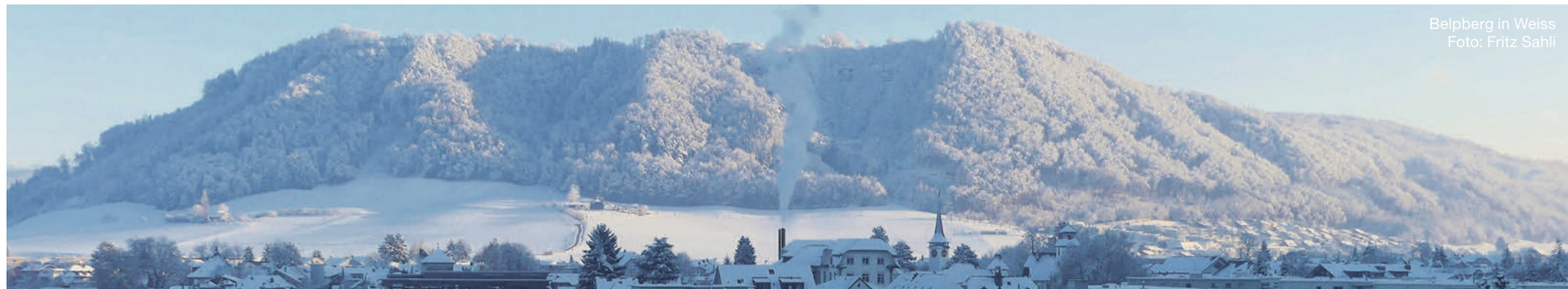
Belpberg in Weiss