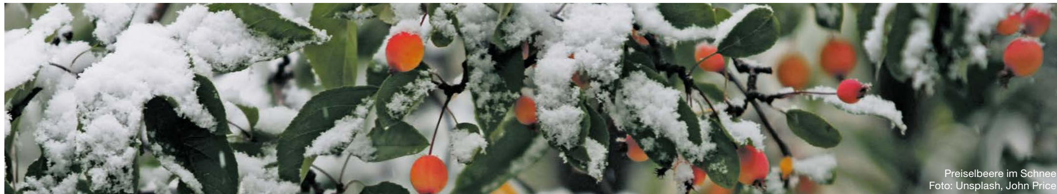
Preiselbeere im Schnee

Belp | Gerzensee | Guggisberg | Jaberg Kaufdorf | Kirchdorf | Niedermuhlern Riggisberg | Rüeggisberg | Rüscheegg Schwarzenburg | Thurnen | Toffen | Wald