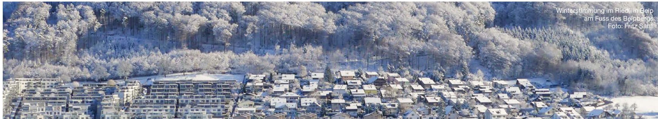
Winterstimmung im Riedli in Belp am Fuss des Belpbergs