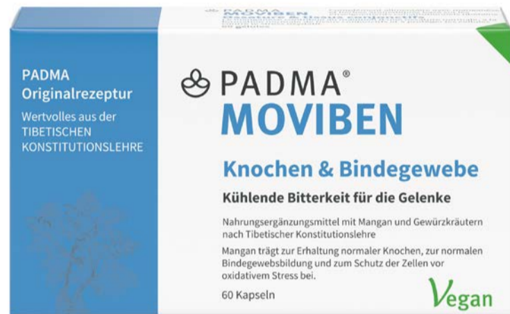
PADMA MOVIBEN Nahrungsergänzungsmittel mit Manga

Mumijo, auch «schwarzes Gold der Berge» genannt, mit Bitterstoffkräutern